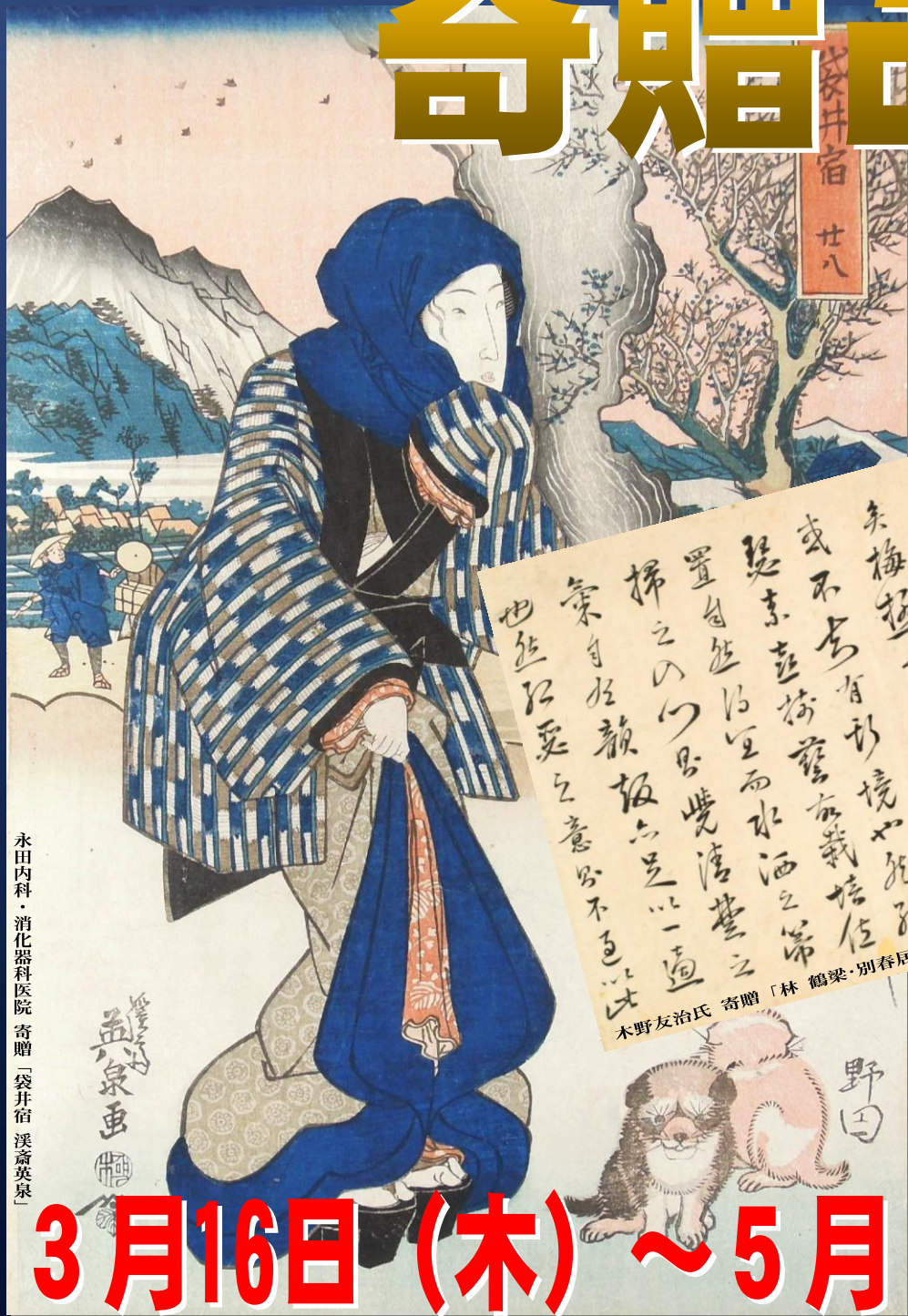
永田内科・消化器科医院 寄贈「袋井宿 漢泉英泉」