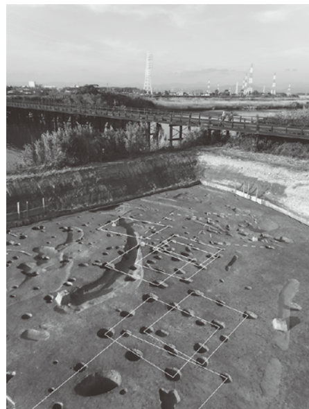
太田川河川改修に伴う調査 (袋井市富里遺跡)→