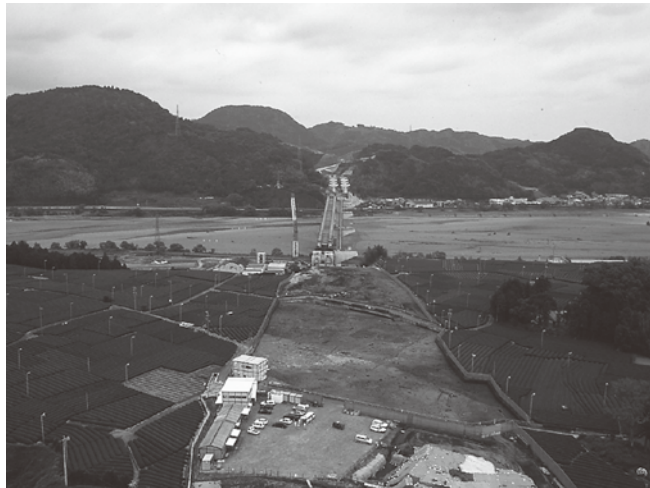
←新東名建設に伴う調査 (島田市駿河山遺跡)