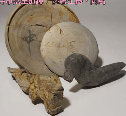
ふくし 袋井市富里遺跡 / 墨書土器・陶馬