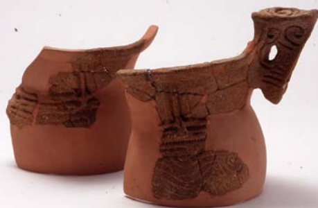
うすまがや 島田市駿河山遺跡 / 縄文土器