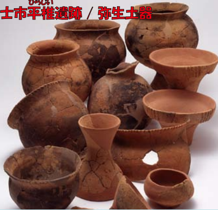
ひらひら 富士市平権遺跡 / 弥生土器