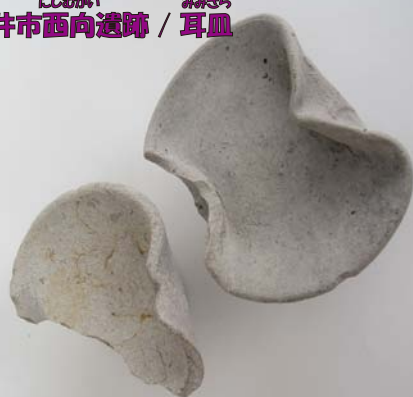
にしあか 袋井市西向遺跡 / 耳皿