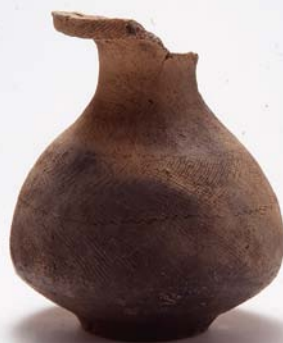
うすまがや 島田市駿河山遺跡 / 弥生土器