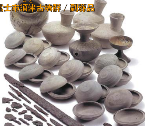
ふじ 富士市須津古墳群 / 副葬品