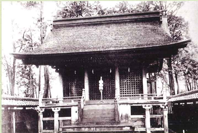
富士浅間宮本殿古写真